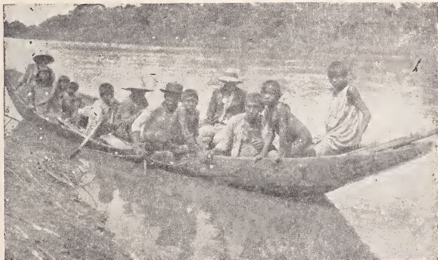
Indios de Mariña en su tradicional curiara.